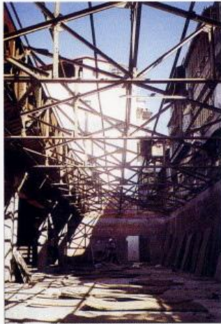
大趨勢開幕修時的鋼骨結構。